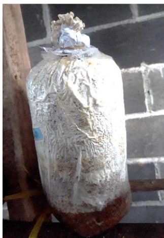
Gambar 2 Badan Buah Muncul Sebelum Miselium Memenuhi Baglog

Nutrisi yang cukup dapat merangsang pertumbuhan miselium sekunder yang selanjutnya membentuk badan buah jamur. Nutrisi yang diserap jamur untuk proses pembentukan badan buah ialah hasil dari penguraian selulosa dan hemiselulosa. Kandungan nutrisi tepung sorgum, tepung jagung dan bekatul padi berbeda. Biji sorgum mengandung 11,4% selulosa, hemiselulosa 17,3% dan lignin 9,35%. Biji jagung mengandung 23% selulosa, hemiselulosa 67% dan lignin 0,1%. Bekatul padi mengandung 7 - 11,4% serat kasar (selulosa, hemiselulosa dan lignin).